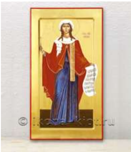
СВЯТАЯ МУЧЕНИЦА ТАТЬЯНА

Чтоб всегда под счастливой звездой Вас судьба по дороге вела. В доме чтоб полноводной рекою Жизнь спокойно и мирно текла, Пусть Ваш дом лишь друзья посещают, Стороною обходят ненастья, От души мы добра Вам желаем, Долгой жизни, здоровья и счастья!